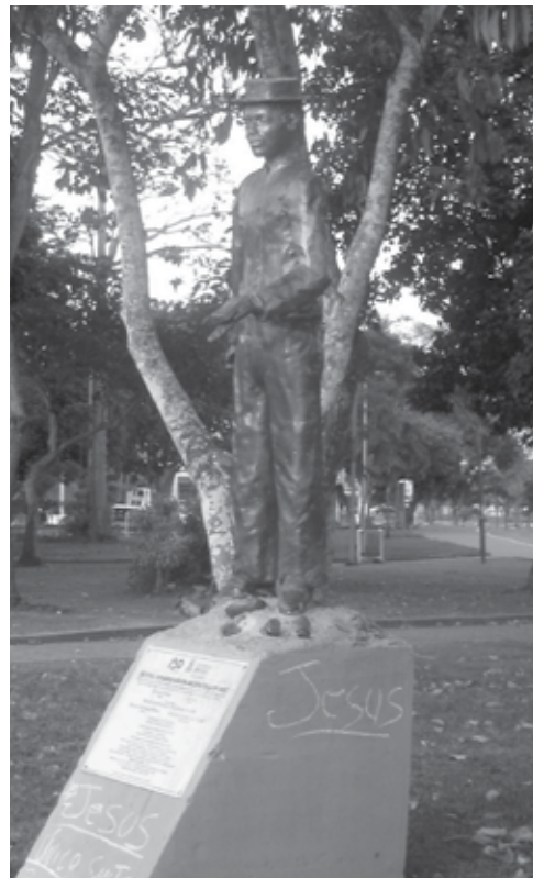
Estátua de Carga d'Água está na Praça da Fiep, às margens do Açude Velho, e seu túmulo, no Cemitério do Monte Santo

No túmulo de Carga d'Água consta que ele faleceu em idade bem avançada para a época, aos 70 anos, em 1911, portanto não foi mártir de nada e nem tampouco um desvalido, pois se fosse um pobre morreria bem mais cedo e estaria numa vala comum, sem epítáfio ou localização precisa.