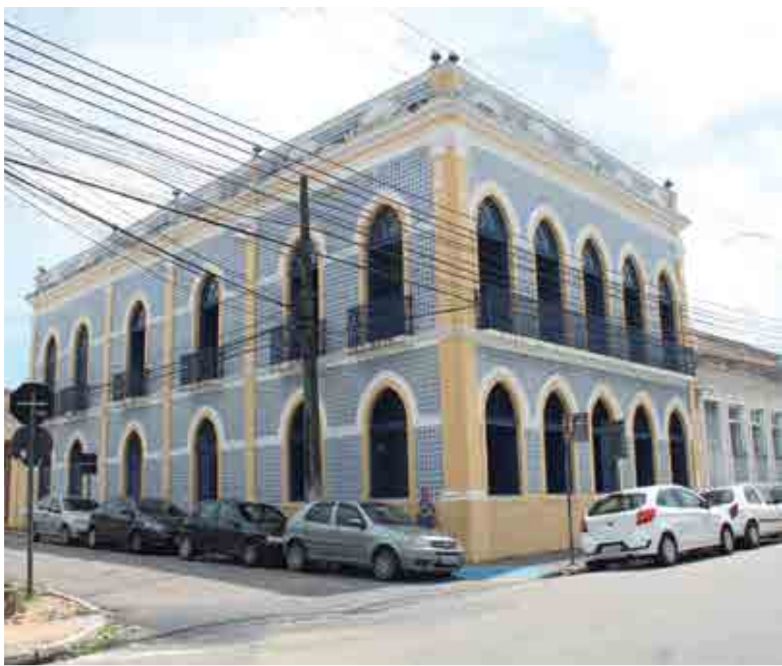
Localizado no Centro de JP, Casarão dos Azulejos dá lugar a homenagem, sarau e lançamento nesta quinta-feira