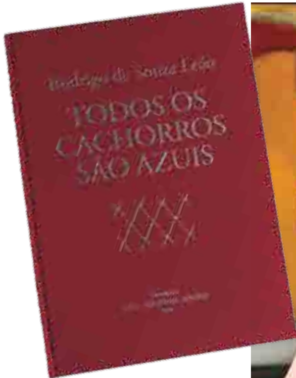
Rodrigo e a capa da nova edição de 'Todos Os Cachorros São Azuis': autor era esquizofrênico, mas a sua literatura se inscreve entre as mais saudáveis que já foram escritas no Brasil

Pois bem. Alegria-me constatar que, paulatinamente, a obra de Rodrigo começa a repercutir, a ponto de o prestigiado Selo Demônio Negro, de São Paulo, editá-la. Primeiro, Todos Os Cachorros São Azuis – já traduzido e publicado na