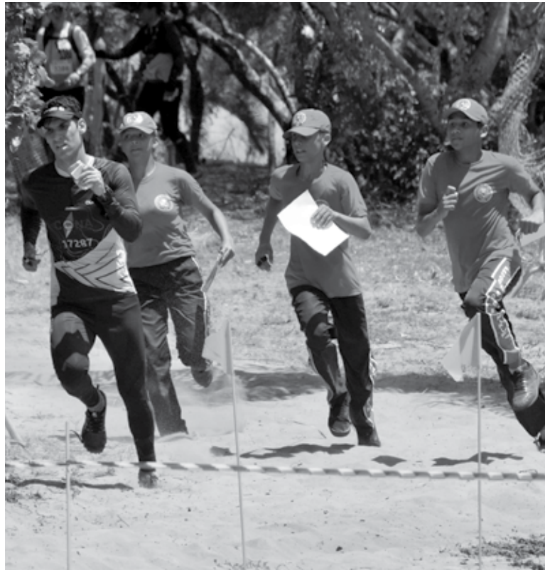
A IX Copa Nordeste de Orientação foi disputada na cidade de Vila Flor-RN