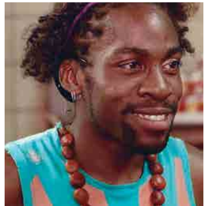
Lázaro Ramos estrela comédia, exibida em sessão com audiodescrição

A trama gira em torno de 12 personagens diferentes que buscam se divertir do jeito que po-