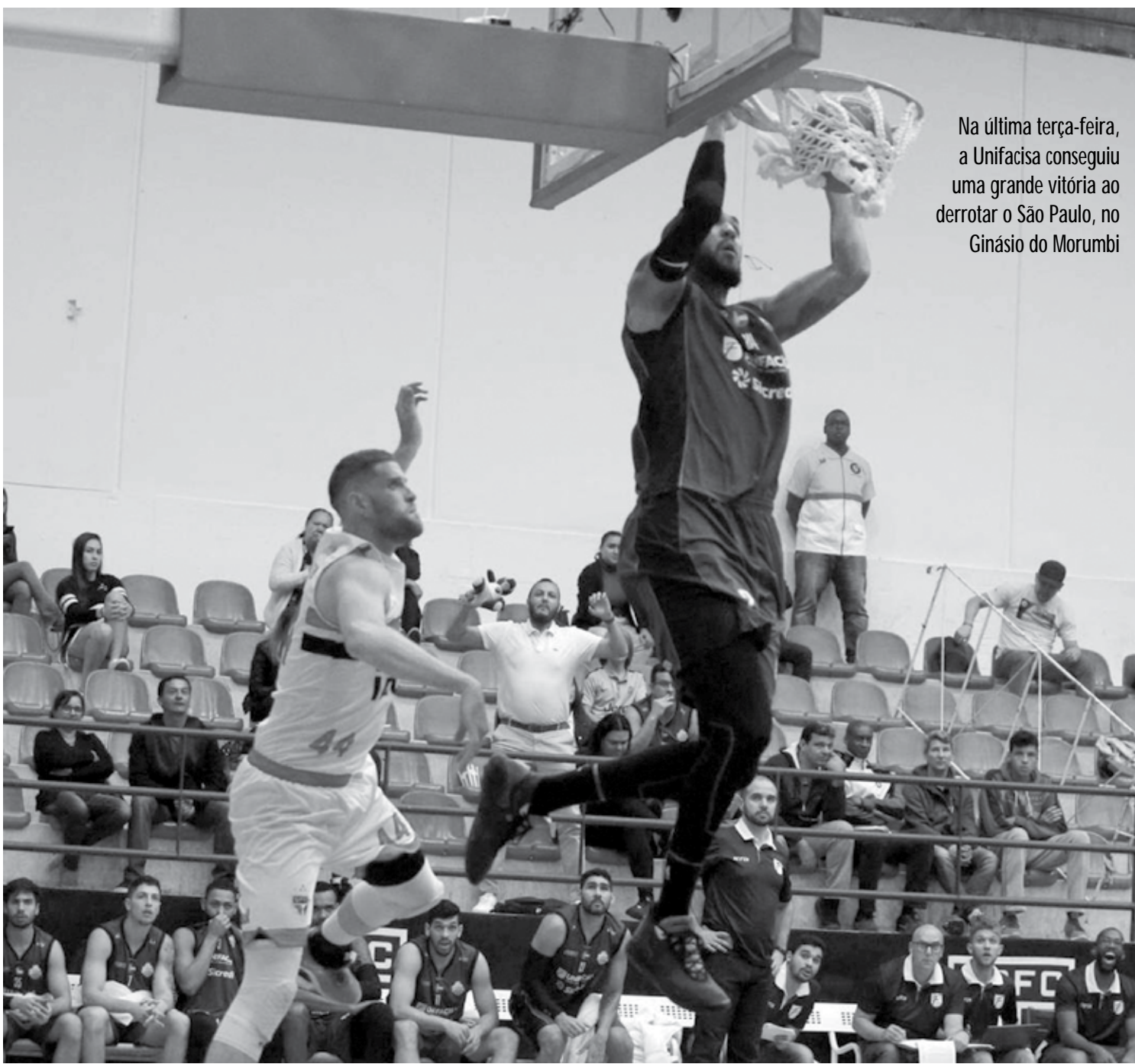
Na última terça-feira, a Unifacisa conseguiu uma grande vitória ao derrotar o São Paulo, no Ginásio do Morumbi