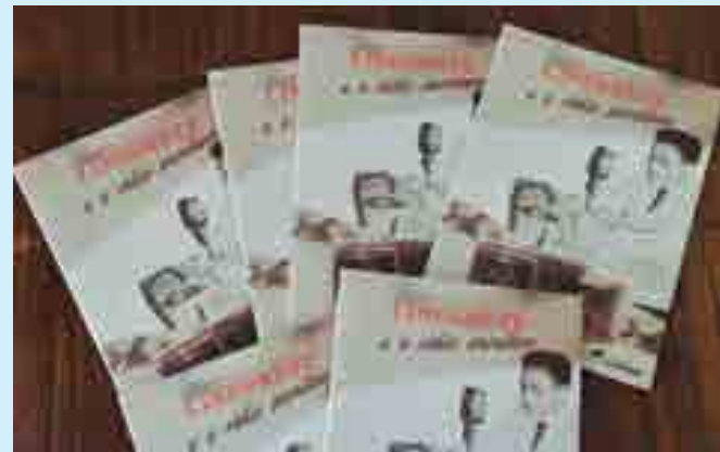
A plaquete, Linduarte e o Rádio Paraibano, foi lançada durante o Fest Aruanda